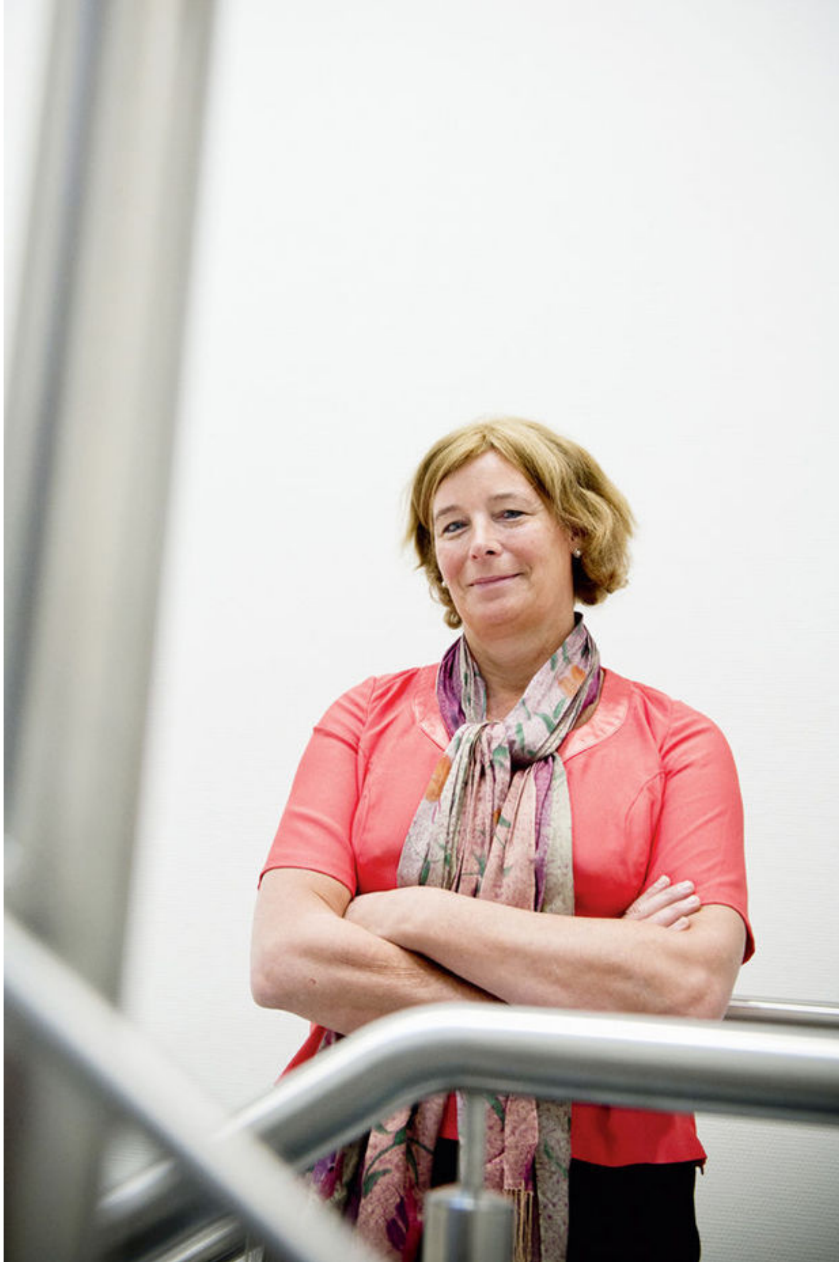
Petra De Sutter