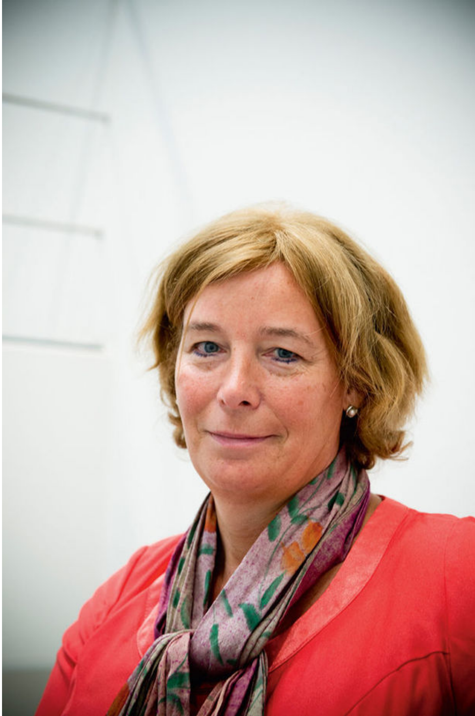
Petra De Sutter

Toch aarzelt de Europese Commissie om er iets aan te doen, en daar verstoppen de lokale overheden zich achter. Niet alleen oefenen lobbygroepen druk uit, ook met het oog op de onderhandelingen over het vrijhandelsakkoord met de Verenigde Staten deinst Europa ervoor terug om hormoonverstoorders aan banden te leggen.