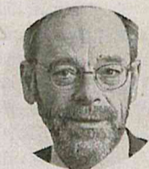
Peter De Roover Federaal fractieleider van de N-VA.

PANDEMIEWET De impact van technocraten op het covidbeleid is volgens Peter De Roover typerend voor de krimpende invloed van democratisch verkozen politici.