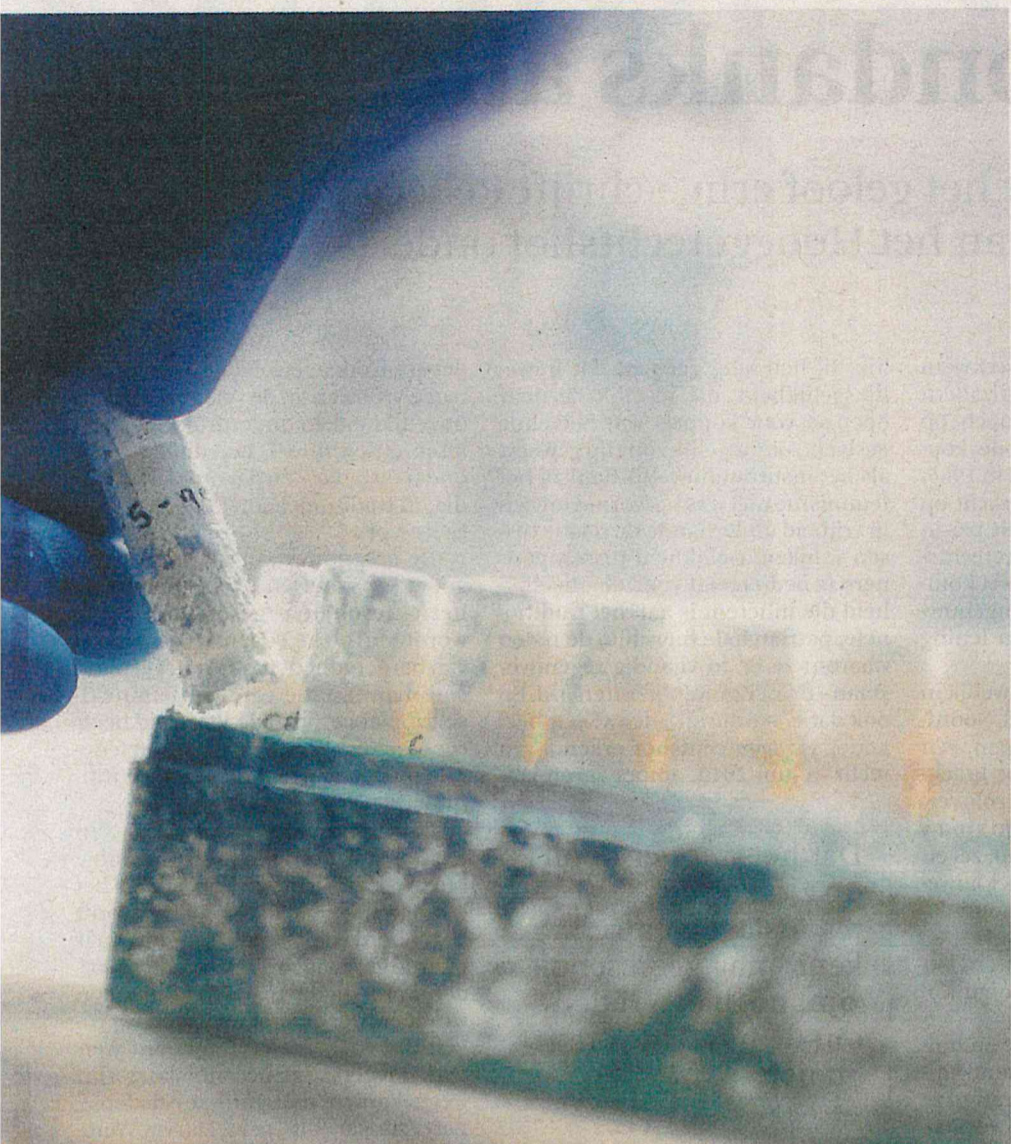
Donoranonimiteit moet nu echt wel op de schop.

zijn. Ik heb nog geen ouder-kindrelaties weten stuklopen omdat een donorkind contact had met de donor.